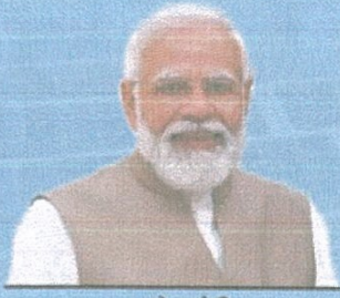
नरेन्द्र मोदी प्रधानमंत्री